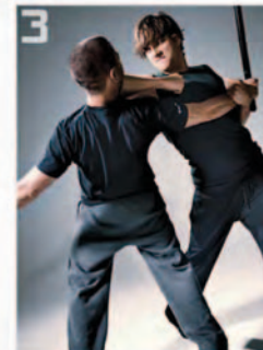
3 Ashton Kutcher dans le film Kiss and Kill