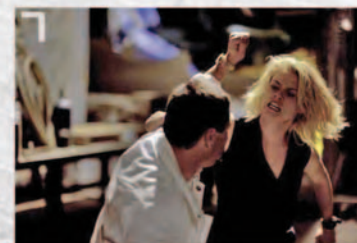
7 Abby Samspon dans la série Drôles de Dames