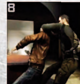
8 Sam Fisher dans le jeu vidéo Splinter Cell Conviction