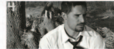
4 Joe Manganiello dans la série True Blood