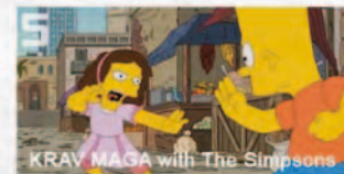
5 Bart dans un épisode des Simpsons