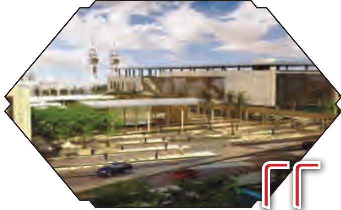
جامعة خادم الحرمين الشريفين منارة للعلم ومنبر للدعوة