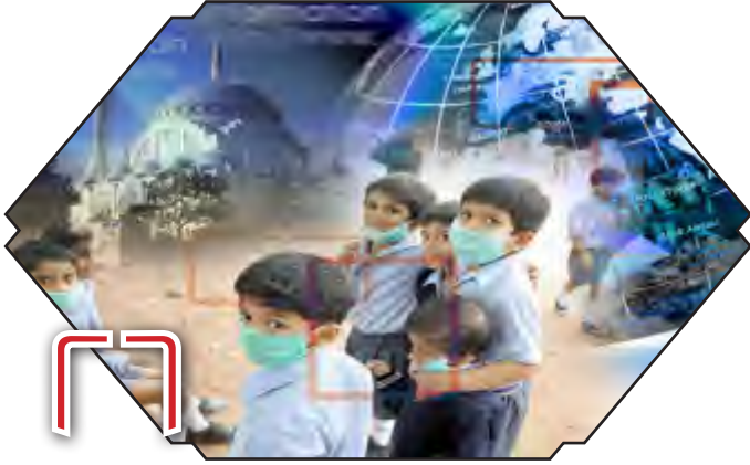
انفلونزا الخنازير نظرة شرعية