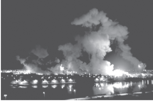
شكل ٤-٢: قصف بغداد في مارس ٢٠٠٣ أثناء عملية الصدمة والرعب. 2

إن الحد من الأسلحة وإدارة الأزمات (التي تمثل في الواقع جزءاً رئيسياً من عملية الحد من الأسلحة) على نحو فعال «ليسا» من إجراءات التهدة؛ فهما يمثلان وسيلة — ربما الوسيلة العملية الوحيدة — لمنع النزاعات وإخمادها وإدارتها في عالم خطِر، فيه دول كثيرة ما زالت حائزة لأسلحة الدمار الشامل.