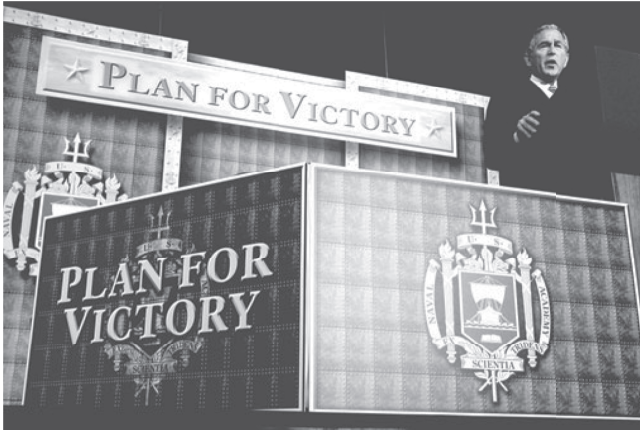
شكل ١-١: أعلن الرئيس جورج بوش الابن شَنَّ «حرب على الإرهاب» بعد أحداث الحادي عشر من سبتمبر. وكان تنظيم القاعدة قد أعلن سابقاً «جهاداً عالمياً» ضد الولايات المتحدة وحلفائها. 1

إمكانات الولايات المتحدة — العسكرية والاقتصادية — بصفتها قوة عظمى لفرض تغيير النظم والترجيح النشط للديمقراطية واقتصاد السوق. ويظهر أنَّ المحافظين الجدد، بثقتهم شديدة الإفراط في قوتهم — التي تذكّرنا بقيادة الإمبراطورية البريطانية في العصر الفيكتوري — صدّقوا أنه بإمكانهم إعادة تشكيل العالم ليصبح مثل الصورة التي في مخيلتهم. وقد جاء الدليل الدامغ على استعداد المحافظين الجدد لتحديّ معايير النهج التعديدي، وقيود ميثاق الأمم المتحدة، والقانون الدولي العرفي، مصاحباً لغزو الولايات المتحدة للعراق واحتلاله، اللذين تمّأ بمساعدة حكومة المملكة المتحدة في تحدّي سافر لمجلس الأمن التابع للأمم المتحدة. وقد كان لقفز القوة العظمى الوحيدة المتبقية تجاه النهج الأحادي والنزعة القومية العدوانية؛ تداعيات خطيرة على العلاقات الدولية بصفة عامة، وسرعان ما تحطّمت الآمال في حدوث اتفاق بين القوى الكبرى في مجلس الأمن التابع للأمم المتحدة بهدف ابتكار حلول سياسية ودبلوماسية متعددة الأطراف لمشكلات النزاعات في عالم ما بعد الحرب الباردة.