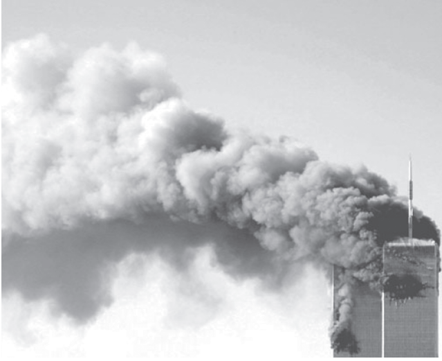
شكل ٢-٤: برجاً مركز التجارة العالمي بنيويورك يشتعلان، بعد أن اصطدمت بهما طائرتا ركاب، استولى عليهما مختطفون انتحاريون من تنظيم القاعدة في ١١ سبتمبر ٢٠٠١. 4

مساهمة كبيرة في توفير الإغاثة، حتى في أكثر حالات الأزمات الإنسانية مشقّة، مثل تسونامي المحيط الهندي (٢٠٠٤)، وكارثة زلزال باكستان (٢٠٠٥). فحكومات البلدان المنكوبة تصير عديمة الحيلة في مواجهة الكوارث واسعة النطاق. والمساعدات المقدّمة من الحكومات الأخرى؛ بالغة الأهمية، ولكن لا يمكن الاكتفاء بها أبداً. وما يمكن للمنظمات الإنسانية من غير الدول تقديمه بسرعة فائقة في مثل تلك الحالات هو المعرفة والاتصالات المحلية بالمجتمعات المنكوبة، وخبرة هائلة في إيصال المعونة الإنسانية، وعون الخبراء المحترفين، مثل الأطباء والمرضات وما إلى ذلك، و(عادةً) خبرة واسعة في العمل مع الحكومات المضيفة والمنظمات الحكومية الدولية، مثل الأمم المتحدة.