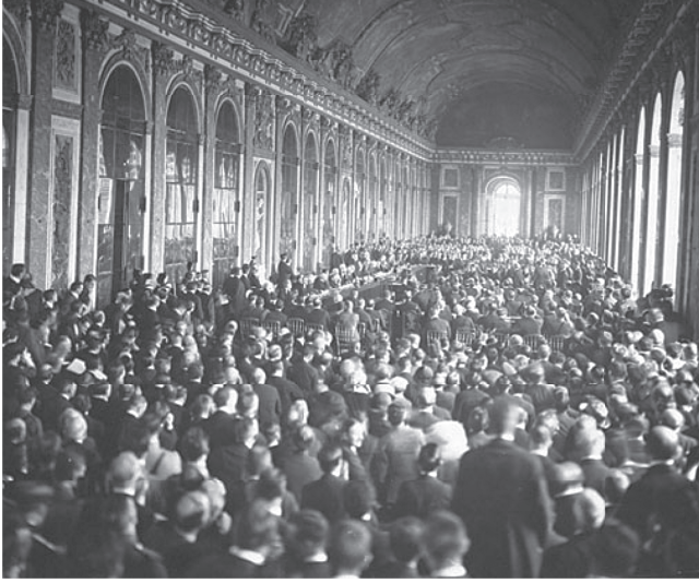
شكل ٢-٢: أعاد مؤتمر باريس للسلام رسم خريطة أوروبا بعد الحرب العالمية الأولى. ويذهب النقاد إلى أن معاهدة فرساي حملت بذور الحرب العالمية الثانية. 2

وتتمثل النقطة الثالثة، التي تصدّرت مقالة إي إتش كار القصيرة الرائعة باسم «القومية وما بعدها» (١٩٤٥)، في أن انتشار المذاهب والحركات القومية أدى — على النقيض من تكوين عائلة سعيدة من الأمم — إلى مفاقمة النزاع الدولي؛ فالواقع أنّ مذاهب القومية وفّرت مبرراً إضافياً للثورة والحرب، وشكّلت أساساً للالتزام الشعبي بالصراعات القومية، وللمشاركة فيها، وقدمت مسوغاً سياسياً قوياً وأداة دعائية لحشد الجيوش الجماهيرية وشنّ «حروب شاملة».