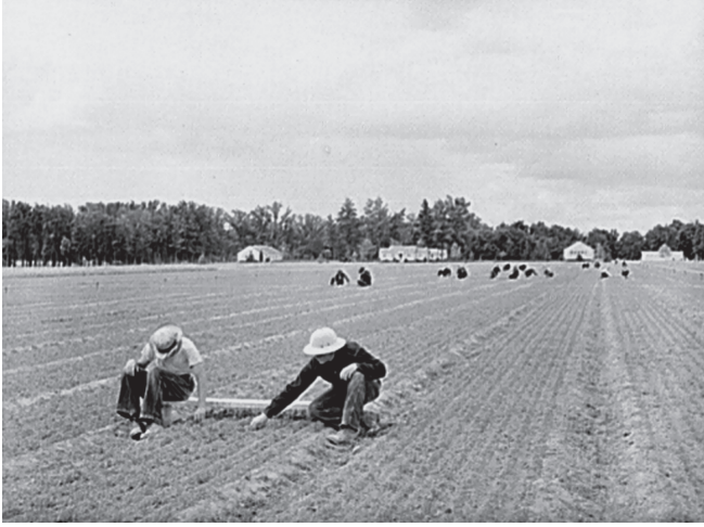
شكل ٦-١: أطفال ينتمون لسلك الخدمة المدنية يزعجون الحشائش من مشتل تابع لهيئة وادي تينيسي بالقرب من سد ويلسون في ولاية ألاباما.

للجنوبيين من البيض أن يتقبّلوها، وكثيرًا ما عقدت المدن الجنوبية استفتاءاتٍ صوّتَ فيها المواطنون لصالح السلطة العامة ضد الشركات المحتكرة الخاصة، في ظل دعمٍ من ليلينثال. جاءت مقاومةٌ قويةٌ غنيّةٌ بمصادر التمويل لهذه الاستفتاءات من مؤسساتٍ الطاقة الخاصة التي تملكها شركة «كومولث آند ثاذرن» القابضة، التي ترأسها وينديل ويلكي، الديمقراطي الذي دعم روزفلت في عام ١٩٣٢. وقد أضعفت هيئة وادي تينيسي من مَيلٍ ويلكي نحو الإدارة؛ ففي حين تفاوَصَ ويلكي نفسه مع الهيئة، حاربَ توسّعها أعضاءً في الشركات المشكّلة لكومولث آند ثاذرن، وكانت استجابة الهيئة والمدن الجنوبية بأن عملوا على إقناع إدارة الأشغال العامة ببناء خطوط ووحيدات لمنافسة شركات الطاقة الخاصة، أو حتى مجرد التخطيط لبنائها، وجعل الجنوب في غنى عنها. وكثيرًا ما وُفرت خطط إدارة الأشغال العامة وحدها النفوذ الفيدرالي الكافي، فباعَت شركات الطاقة الخاصة بنيتها التحتية وآلَت إلى السيطرة العامة المحلية. ٨