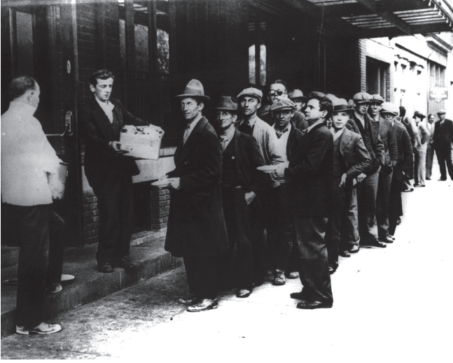
شكل ٣-١: يقف هؤلاء الرجال في طابور الخبز بمدينة نيويورك عام ١٩٣٢.

هذا العبء أكثر من ذلك. ويأخذ السلع من البقال بالحي، واللحم من الجزار بالأجل. ويؤجل صاحب العقار تحصيل الإيجار حتى يحين دفع الفائدة والضرائب ويتعين القيام بشيء ما. يستنفد كل هذه المصادر في النهاية على مدار فترة من الزمن، ويصبح من الضروري لهؤلاء الناس، الذين لم تكن لديهم حاجة أبداً من قبل، أن يطلبوا المساعدة. 6 عندما خذلت الأسرة والجيران العمال، كان بإمكانهم أحياناً الحصول على المساعدة من صناديق المساعدة المشتركة التي كان يجري تنظيمها محلياً مثل خطط الأيام العسيرة أو أموال الأرملة والأيتام التي يخصصها اتحاد من الاتحادات العمالية أو مجموعة من مجموعات العمل المدني. وغالباً ما أعدّ الأمريكيون تلك الخطط في إطار مجتمعاتهم الدينية أو العرقية، من باب الكبرياء، للحنول دون اضطراب واحد من بني جلدتهم إلى اللجوء إلى المؤسسات الخيرية أو إلى ما كانوا يشعرون أنه أكثر مهانة، وهو اللجوء إلى الغوث الحكومي. ولذا استمر الأمريكيون البولنديون والأمريكيون الألمان وكنائس الأبرشيات ومرتادوها وغيرهم من مختلف المجتمعات في مساعدة الوكالات التي حاولت تقديم العون إلى المكروبين منهم ومؤازرتهم حتى يأتيهم العمل. وقد صرّح أحد الكهنة