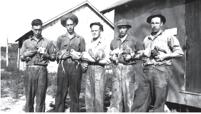
شكل ٥-١: عمل هؤلاء الرجال، وهم أعضاء في سلك الخدمة المدنية، بمرزعة لتربية الدواجن في جونزفيل، بولاية فيرجينيا.

لم يُعَنَّ أيُّ من مخططي السياسة الزراعية بتناول مشكلات الأمة الأزلية المتسبِّب فيها فقرُ المناطق الريفية، أو المشكلات الجديدة التي نتجت عن الكساد الكبير. كان الهدف من القانون تحديداً هو القضاء على عدم التكافؤ في القوة الشرائية بين الريف والمدينة عن طريق العودة إلى عصرٍ ذهبيٍّ خياليٍّ، وليس بالمضي قُدماً إلى عالم جديد تماماً. ولما كان القانون بعيداً كلَّ البُعد عن تحفيز انتعاش الاقتصاد عن طريق مساعدة أغلبية المشترين بالدولة، فرضتِ الضرائبُ التنازلية على إنتاج السلع، التي انتقلت إلى المستهلكين، عقوباتٍ على المشترين في الحضر لمصلحة البائعين في الريف.