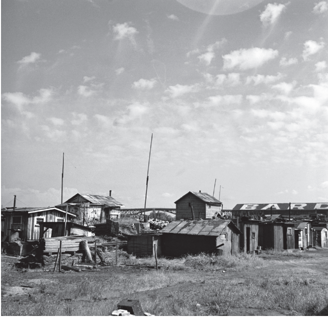
شكل ٢-٣: أكواخ واضعي اليد تحتلُّ ضفئتي نهر ويلامت في إحدى «مدن هوفر» بالقرب من بورتلاند، بولاية أوريغون.

التوقيت التاريخي؛ فالأمريكيون السود، الذين كانوا لفترة طويلة سكاناً للريف، انتقلوا عموماً إلى المدن منذ وقتٍ ليس ببعيد، وأُتيحت لهم فُرصٌ أقل لتطوير حياتهم المهنية كعمالٍ مَهْرَةٍ مقارنةً بالأمريكيين البيض. ولكن لم يشكّل نقص المهارات النسبي إلا جزءاً من معدلات البطالة العالية لدى الأمريكيين من أصول أفريقية، وقد لاحظَ العمال السود أنهم «أخِر مَنْ يُعَيَّن، وأول مَنْ يُطْرَد من العمل»، وأن أبواب العمل يسرحون العمال السود عن عمدٍ من أجل أن يستبدلوا بهم عمالاً بيضاً. وقد خلصت دراسة أجرتها الرابطة الحضرية الوطنية في عام ١٩٣١ إلى أنه «كانت هذه الممارسة شائعة جداً بما يجعل المرء يجد ما يبرّر ظنه بأن هذا الإجراء كان يجري تطبيقه كوسيلةٍ للتخفيف من بطالة البيض دون اعتبارٍ لتبعات ذلك على الزوج» 18 .