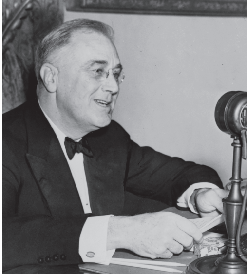
شكل ٤-١: فرانكلين دي روزفلت جالس خلف الميكروفون أثناء أحد أحاديثه إلى جانب المدفأة في عام ١٩٣٧.

العام الأمريكي بهذا الإجراء، عن طريق المزيج الساحر من لكنته الأرسطوقراطية ولغته الواضحة؛ وفي هذه الحالة لن يسع الأمريكيين سوى أن يقولوا: «كان لدينا نظام مصرفي سيء.» وستجاوز روزفلت أيضاً الأسلوب غير الرسمي البسيط ليستخدم الشرح المنهجي للظروف وسياسته، محاولاً بصدق أن يشرح التفاصيل الفنية للحالة الطارئة واستجابته لها. ورغم تهور الإجراء الذي اتخذه روزفلت، فإنه كان يسعى إلى تحقيق أهداف محافظة في الأساس. وكما كتب فيما بعد رايmond مولي، أحد مستشاري روزفلت، فإنه نتيجة لإجازة البنوك «أنقذت الرأسمالية في ثمانية أيام.» 7 أو على الأقل جزء من الرأسمالية، على أية حال. ومع تحقيق إنجازات على هذا المنوال، يمكن أن تتحسن الأزمة التي وجد البلد نفسه يسقط فيها تدريجياً، لتكتسب الإدارة قدرًا من المصادقية وربما الحرية لإجراء إصلاح إضافي ودائم للنظام الاقتصادي الأمريكي.