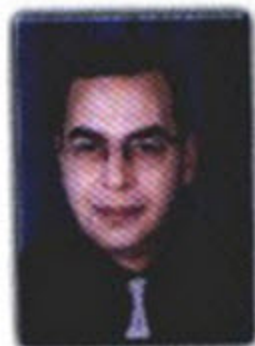
د. أحمد خالد توفيق

سوف نعرف المزيد عنهم .. هل هم قريبون منا إلى هذا الحد ؟ .. أم هم كيانات أسطورية متخفية وبعيدة جداً ؟ .. هل حقاً نملك جميعاً تلك الموهبة ؟ .. هل هم أشخاص مثلنا عرفوا كيف يضجرون ينبوعهم الخاص ؟ .. الأسئلة كثيرة منهكة ، وبعضها بلا إجابة على الإطلاق ، لهذا نتحدث اليوم عن ( أسطورتهم ) ..