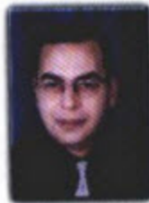
د. أحمد خالد توفيق