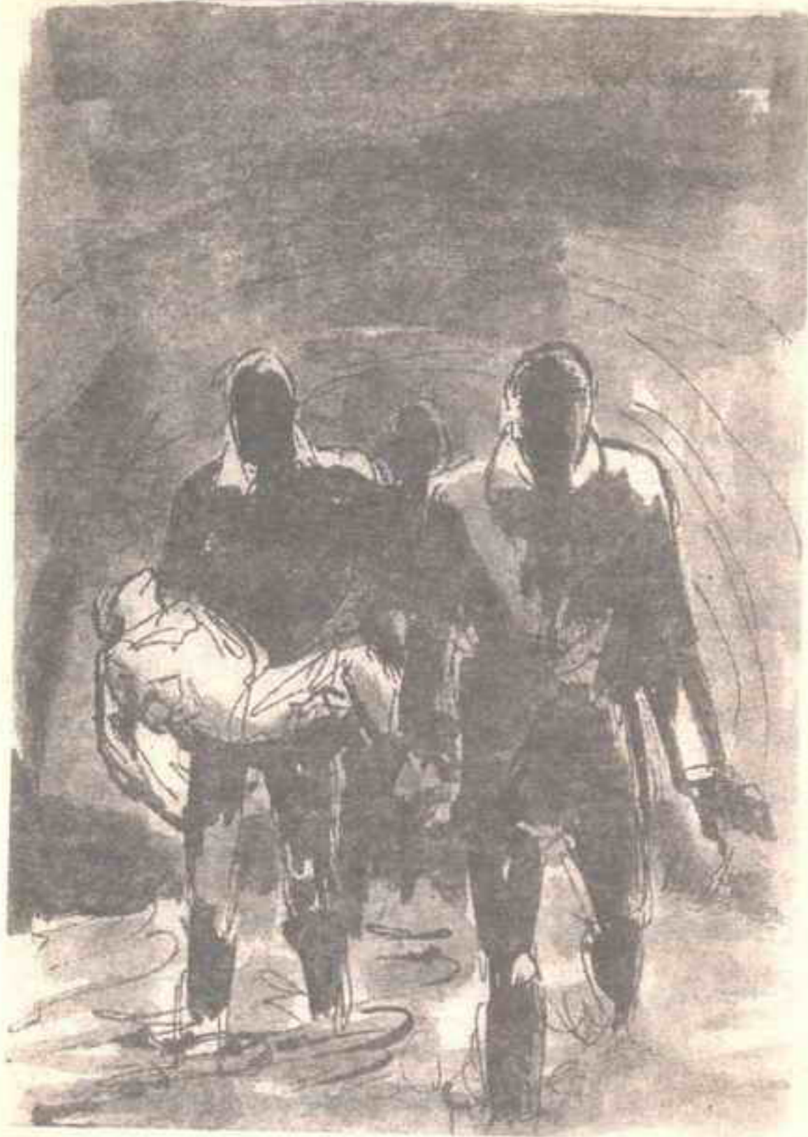
ورحنا نركض لاهئين .. ومياه المجارى تتناثر تحت أقدامنا ..

همست ( سلمى ) وقد فهمت ما يدور بخلدى : - « هلم .. لقد فعلها ( بونابرت ) مع مريض طاعون فى ( عكا ) .. ولم يكن هناك علاج للمرض وقتها .. » - « يا سلام ! لقد فعلها ( بونابرت ) كى يزيل مخاوف الأطباء من المرض ويضرب لهم مثلاً شجاعاً .. وربما فعلها تظاهراً كى يتحدث عنه التاريخ بإعجاب .. لكن ماذا أحاول إثباته أنا ؟ »