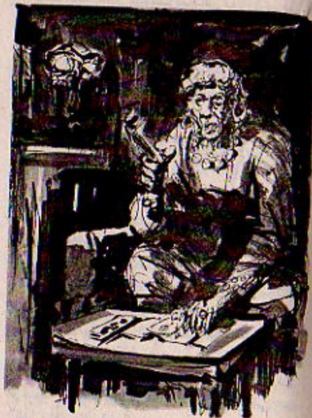
جالسة تدخن السيجار الكوبى قاتل الراحة إياه ، وتعابت أوراق ( التاروت ) بأظفارها المخشبية المصبوغة بالأسود ..

أما العجوز فهى كما تذكرها بالضبط .. شاخت أكثر ، لكنها ازدادت حيوية لو لم يكن فى كلامى تناقض ما .. جالسة تدخن السيجار الكوبى قاتل الراحة إياه ، وتعابت أوراق ( التاروت ) بأظفارها المخشبية المصبوغة بالأسود .. وقد أضافت إلى قبحتها قبحا ببعض علامات التوشم على خديها ، وقرطين عملاقين يذكران بإظارات الشاححات فى أذنيها ..