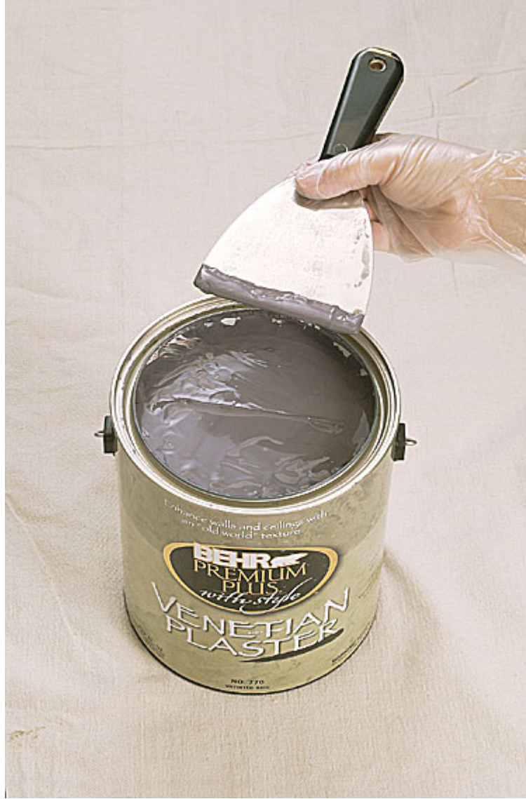
حمل اللصقة الفينيسية على فولاذ يملج