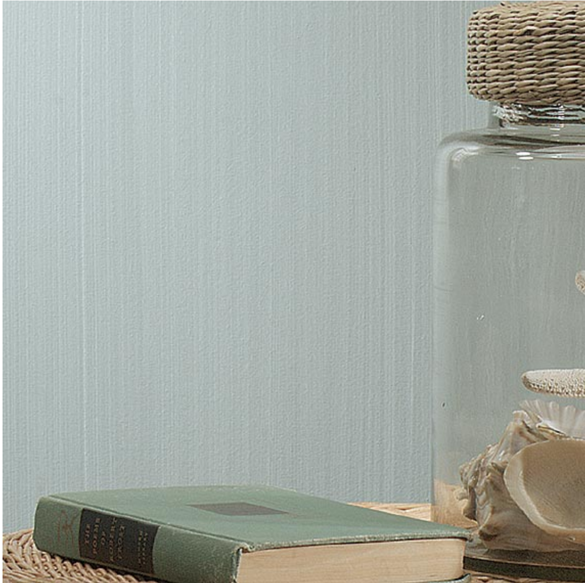
Colorwashing - Textured Look