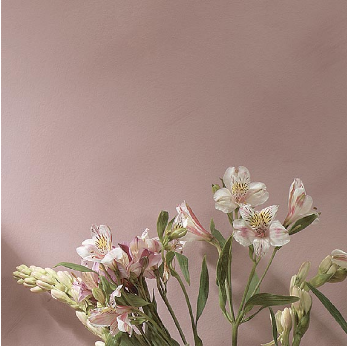
Colorwashing - Cloud Look(الغيوم)