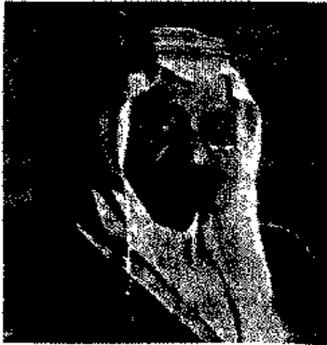
الملك فيصل بن عبد العزيز ملك السعودية

ولكنه عاد إليها .. جثة محمولة .. على طائرة ملكية سعودية خاصة .