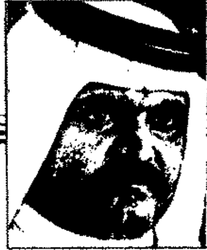
حمد بن خليفة