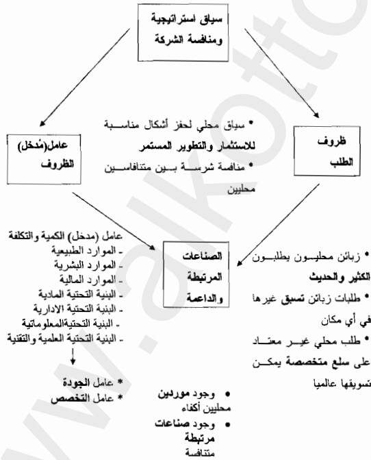
الشكل (1): موارد الميزة التنافسية للموقع

وهناك عناصر قليلة في هذا الإطار تستحق التوكيد، لأهميتها في فهم دور التجمعات في المنافسة. ويتراوح عامل مدخلات الأصول الملموسة، من البنية التحتية المادية إلى المعلومات، والنظام القانوني، ومعاهد البحث التابعة للجامعات، التي تعتمد عليها كل الشركات في المنافسة. ولزيادة الإنتاجية، يجب رفع كفاءة عناصر المدخلات والجودة، و(أخيراً) التخصص في أحد أنشطة التجمع. ولا تقتصر ضرورة العوامل المتخصصة، خاصة تلك المندمجة في الابتكار والتطوير (مثل معاهد الأبحاث الجامعية المتخصصة) على تحقيق معدلات إنتاج عالية، بل إنها تكون أيضاً أقل تجارية أو توافراً من أي مكان آخر.