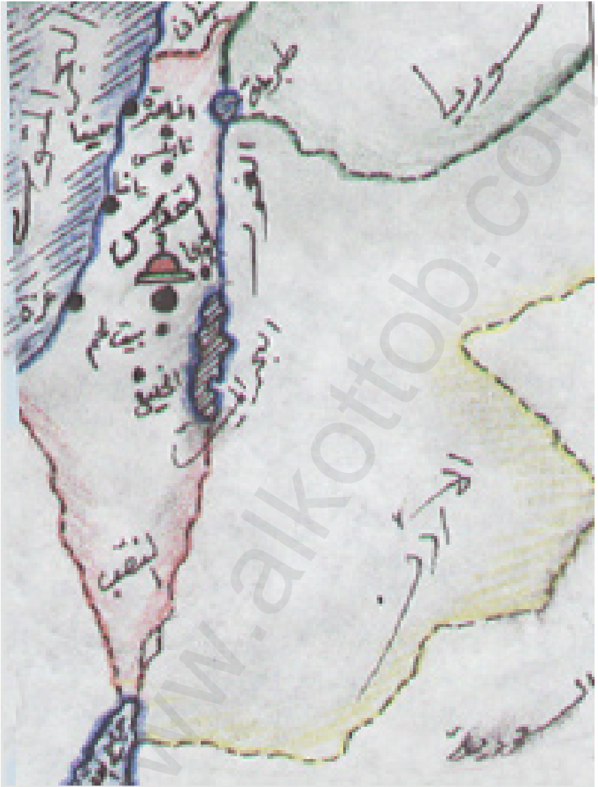
الموقع الجغرافي للقدس