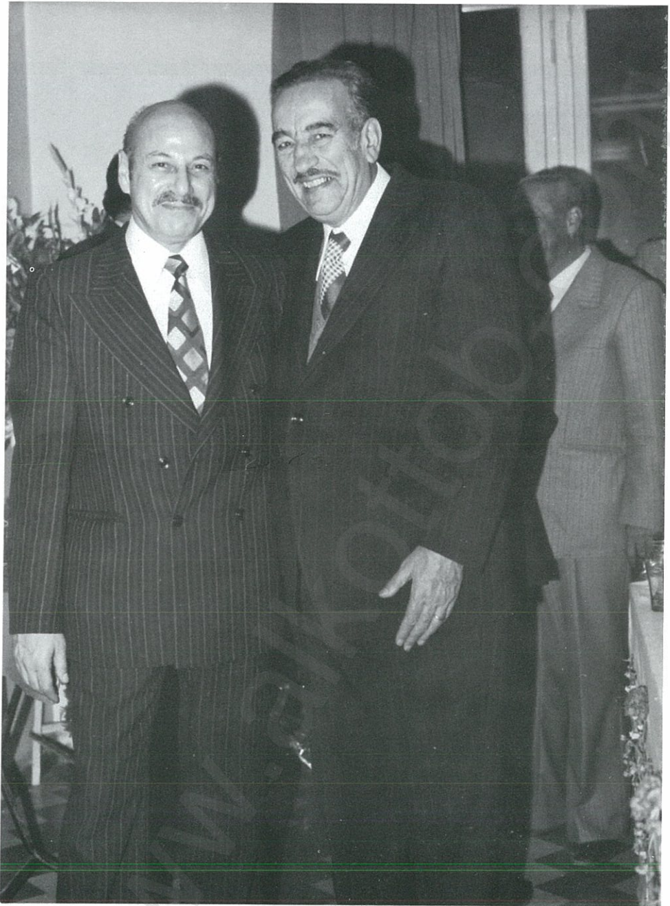
خالد بكداش ويوسف الفيصل