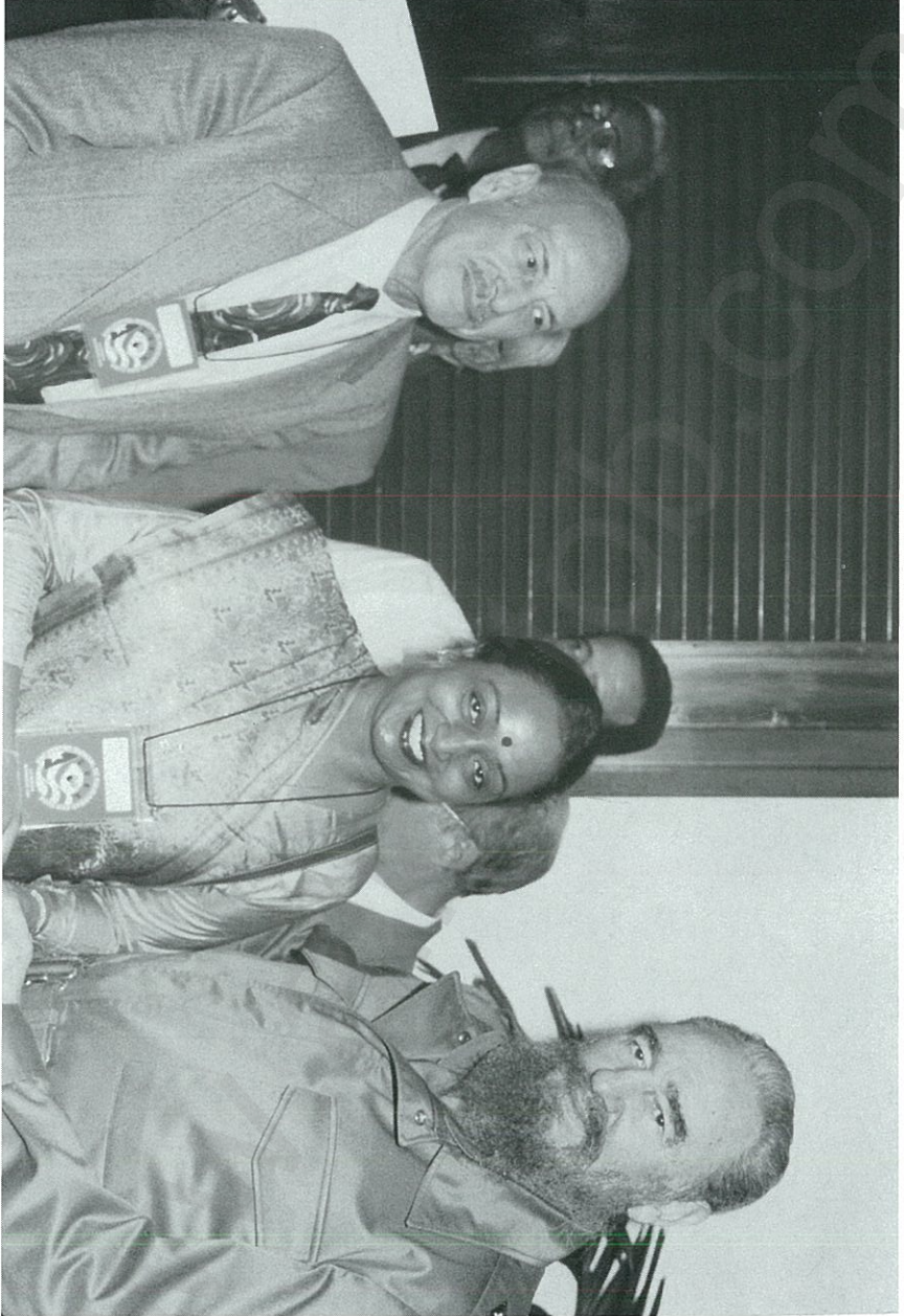
مؤتمر القارات الثلاث في كوتيا