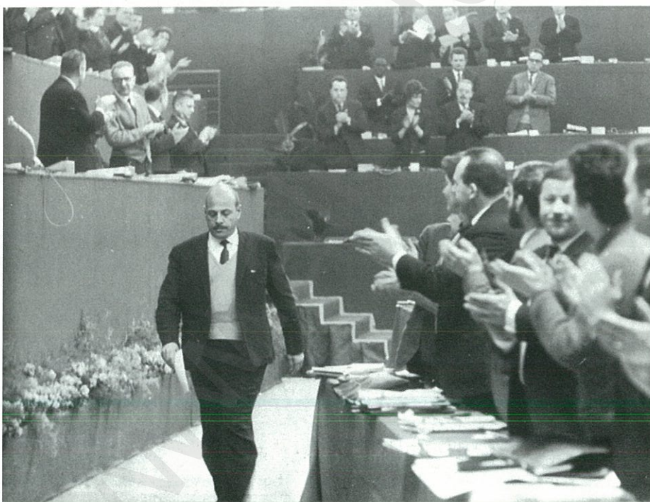
المؤتمر ١٨ للحزب الشيوعي الفرنسي