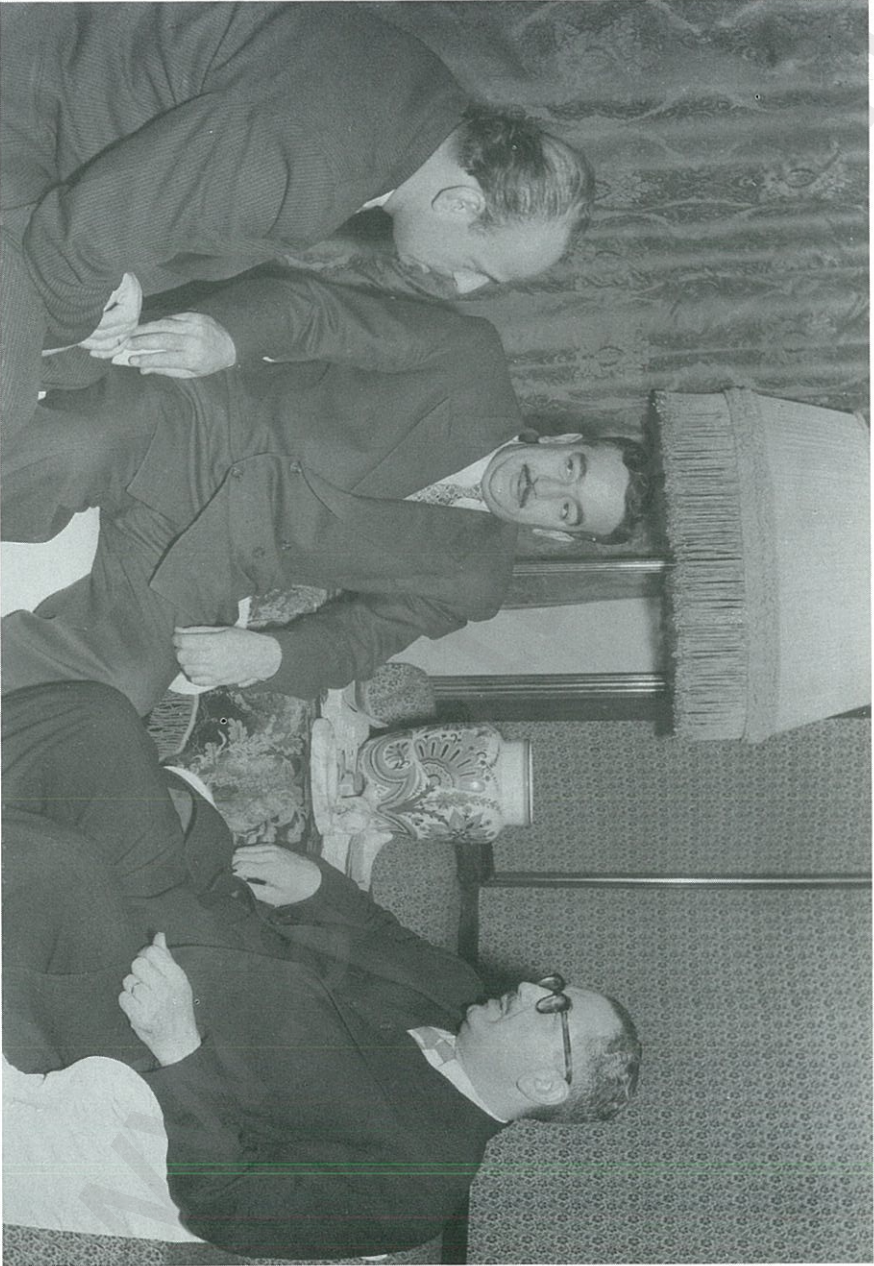
تقولا شراوي - خالد بكداش - يوسف فيصل في موسكو عام ١٩٥٦