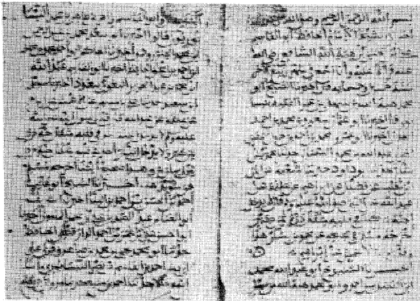
راموز الصّفحة الأولى للكتاب