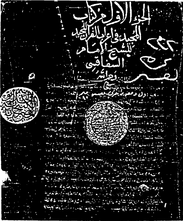
صفحة العنوان من نسخة دار الكتب المصرية