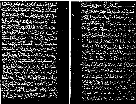
الورقة الأولى من نسخة دار الكتب الظاهرية