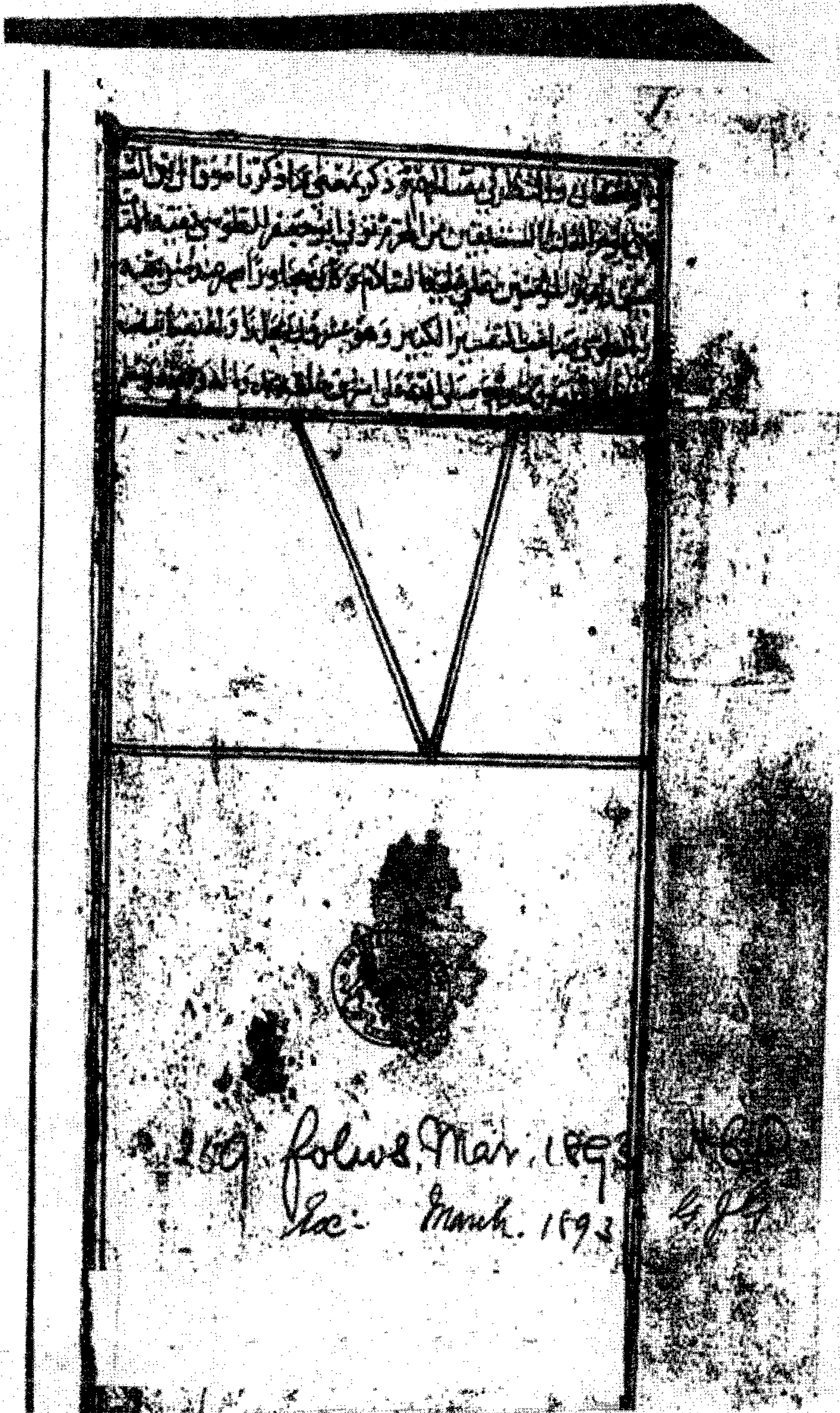
الصفحة الأخيرة من نسخة المتحف البريطاني